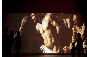
Proiezioni e musica in "Caravaggio experience" - Arte