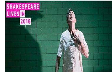
Shakespeare lives in Italy, Bardo è vivo - Teatro