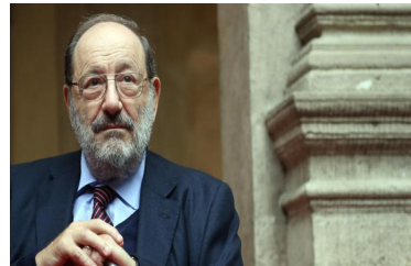
Eco, "No convegni su di me per 10 anni" - Libri